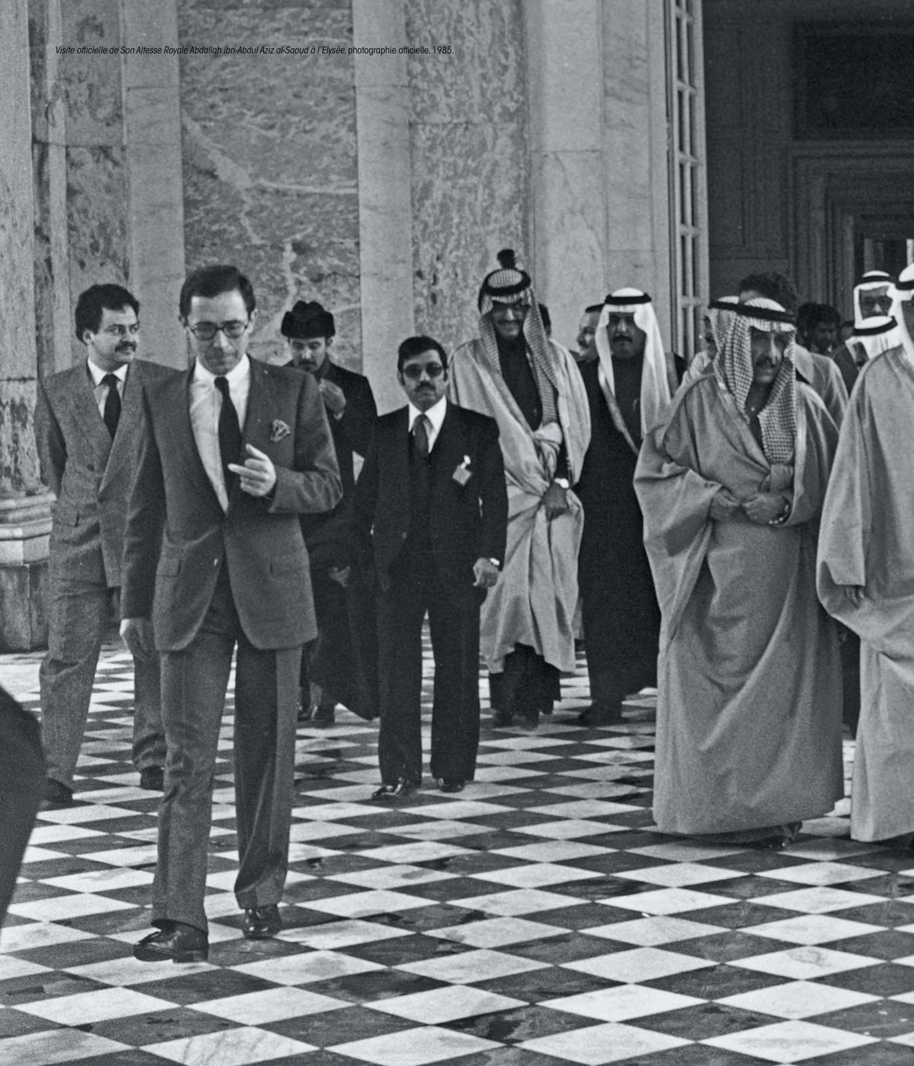
Visite officielle de Son Altesse Royale Abdallah ibn-Abdul Aziz al-Saoud à l'Élysée, photographie officielle, 1985.