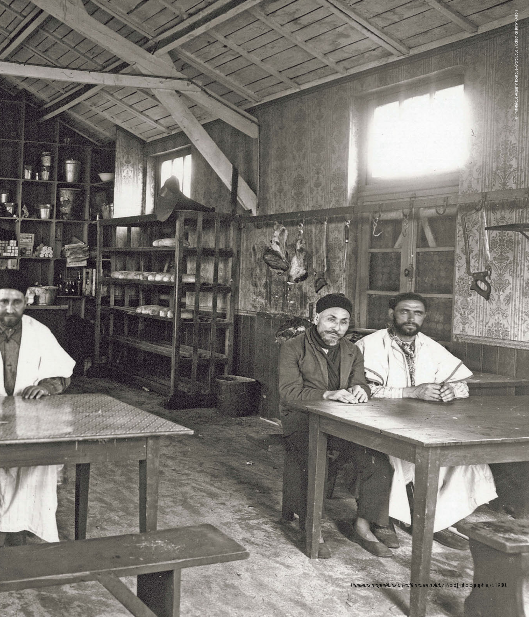
Tirailleurs maghrébins au café maure d'Auby [Nord], photographie, c. 1930.