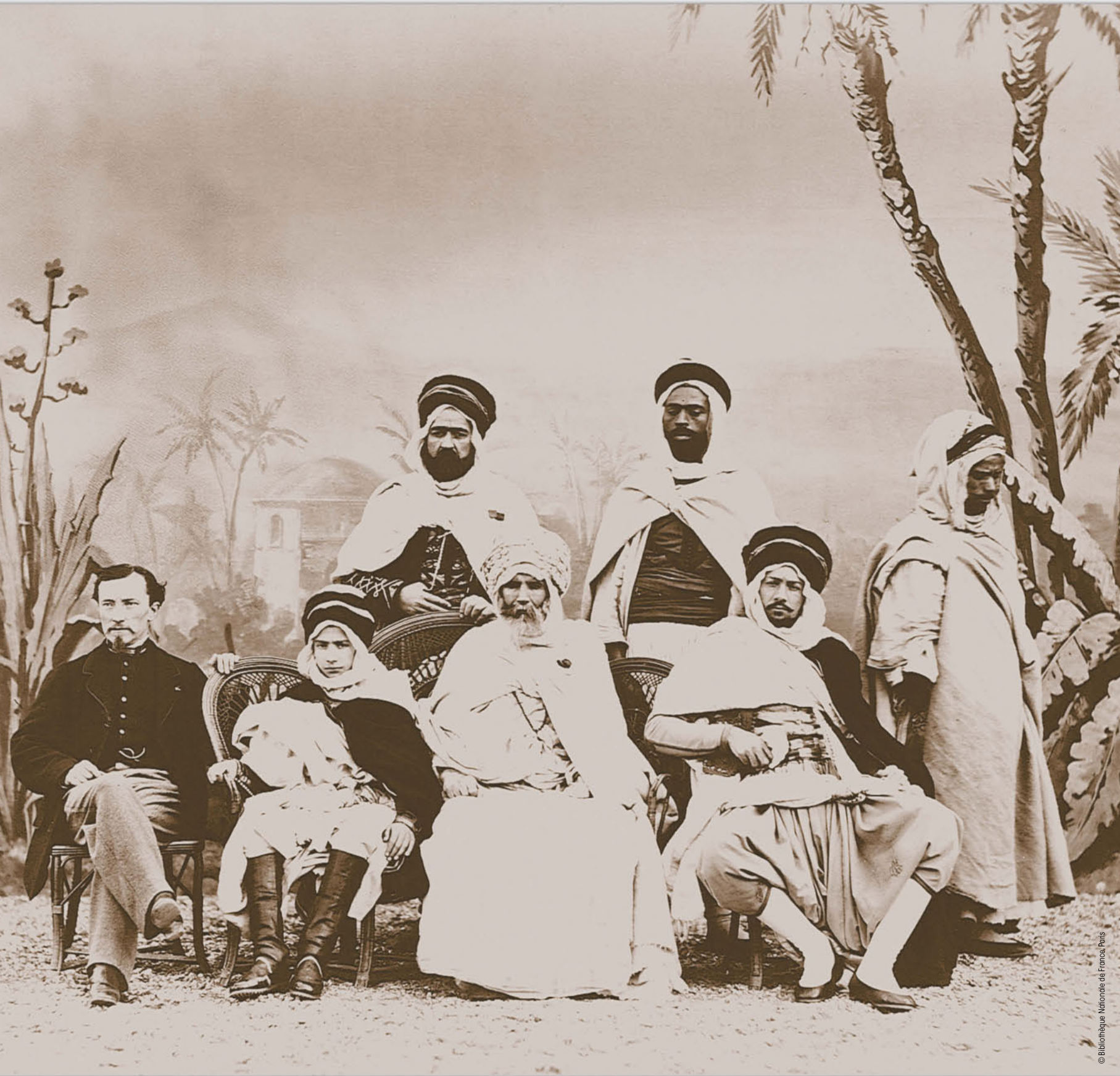
© Bibliothèque Nationale de France, Paris