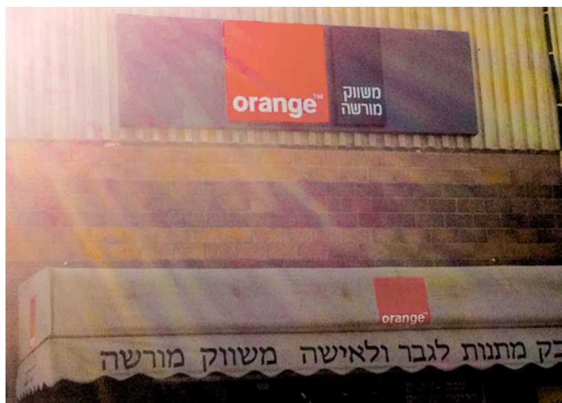
Boutique Orange située dans la colonie d'Ariel.

Mais l'État français est aussi et surtout actionnaire minoritaire principal en possession de 25,05 % du capital, et la seule entité qui, selon Orange, peut exercer un contrôle sur cette entreprise 16 . Sur les 15 membres du Conseil d'administration d'Orange SA, 3 représentent la sphère publique 17 . À cet égard, la France doit assurer la cohérence de ses politiques (entre les recommandations destinées aux particuliers et aux entreprises et le respect de leur mise en œuvre). Elle doit aussi prendre des mesures de protection additionnelles vis-à-vis des activités des entreprises dont elle est actionnaire, comme Orange, y compris des activités de ses relations d'affaires, et user de sa capacité d'influence pour veiller à la mise en œuvre d'une diligence raisonnable par Orange.