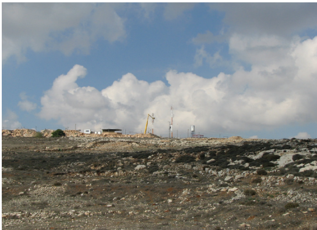
Antenne Partner Communications située dans l'avant-poste de Migron.

Ces informations ont été sélectionnées, recoupées et complétées par un travail d'analyse des auteurs de ce rapport. Interrogés par courrier par les auteurs de ce rapport, Orange et le gouvernement français n'ont à ce jour pas répondu. Le 28 avril, dans la phase d'impression du rapport, Orange a pris contact avec les auteurs de ce rapport pour proposer une rencontre. La dernière demande de rendez-vous des auteurs date du 20 février 2015.